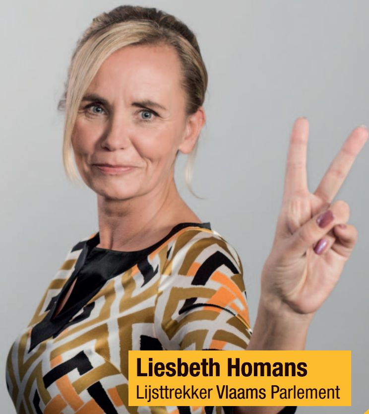
Liesbeth Homans Lijsttrekker Vlaams Parlement

Als burger, als vader en als burgervader zoek ik elke dag oplossingen voor en het welzijn van iedereen die werkt, spaart en onderneemt. Maar zolang we België niet hervormen, staan we machteloos tegenover de hoge belastingen, de faillissementengolf, de verkwistende structuren.