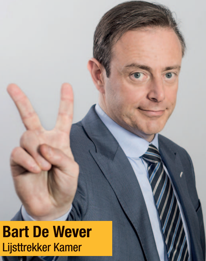
Bart De Wever Lijsttrekker Kamer