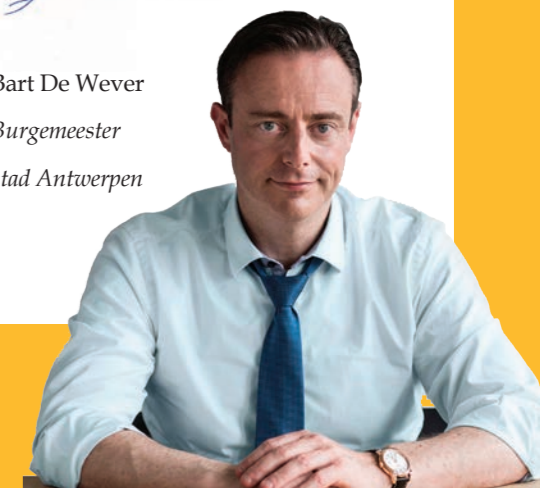
Bart De Wever Burgemeester stad Antwerpen

Kortom: de kracht van verandering blijft tot uw dienst staan.