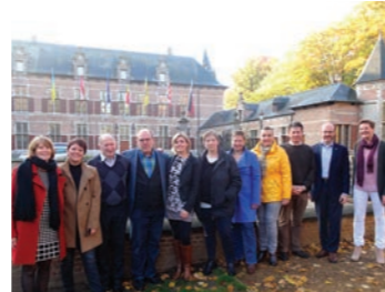
De Ekerse N-VA-ploeg