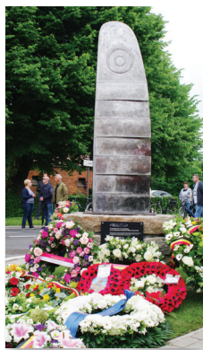
◀ Het monument is een creatie van de Ekerse kunstenaar Stef Van Eyck