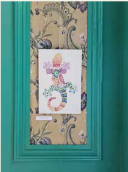
▲ Tijdens de tentoonstelling ‘ik was er (niet) bij’ toonden Ekerse kunstenaars hun creatieve werken.

waardige afsluiter. In oktober exposeerden andere kunstenaars hun werken in de bijzondere garage op Rozemaai, wat veel bezoekers lokte.