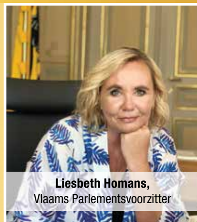
Liesbeth Homans, Vlaams Parlementsvoorzitter

In het één-programma 'Over 5 jaar' stelde VRT-journalist Wim De Vilder eind 2015 een reeks interessante vragen aan een aantal bekende mensen. Hoe zullen de wereld en ons land er over vijf jaar uitzien? En hoe zal je eigen leven er dan uitzien? De interviews van toen werden vijf jaar lang weggestopt. Niemand kon ze bekijken. Voor de negen gasten een reden om echt het achterste van hun tong te laten zien. Ook Liesbeth Homans werd in 2015 geïnterviewd door Wim De Vilder. Vijf jaar later blikte zij samen met hem terug op haar uitspraken van toen. En dat leverde behoorlijk verrassende televisie op.