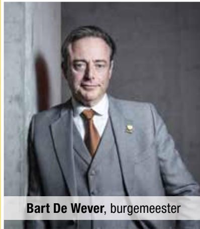
Bart De Wever, burgemeester

“In de strijd tegen drugsgeweld doe ik wat ik moet doen als burgemeester: de veiligheid van alle Antwerpenaars bewaken en zorgen dat onze straten niet het decor worden voor afrekeningen van de drugsmafia. Met Operatie Nachtwacht controleert de politie iedereen die 's nachts in de getroffen wijken op straat komt. Dat leidde al tot een 50-tal arrestaties en de politie nam auto's, wapens, drugs en cash geld in beslag. Mijn oproep aan de nieuwe federale regering: neem ook uw verantwoordelijkheid en bestrijd de internationale georganiseerde misdaad met meer middelen en mankracht.”