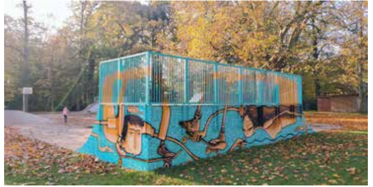
▲ De grijze en donkere betonvlakken van het skatepark maakten plaats voor een kleurrijk kunstwerk.

De keuze viel op streetart die de sporters afbeeldt als langgerekte figuren die in en door elkaar lopen. Je kan er zelfs een hond op een skateboard vinden! De grijze en donkere betonvlakken van het skatepark zijn nu een prachtig en kleurrijk kunstwerk waarvan iedereen kan genieten.