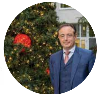
Bart De Wever Burgemeester

Ik wens u en uw naasten van harte een gezellig eindejaar en een fijn nieuwjaar toe, vol gezondheid en geluk . Draag zorg voor elkaar.