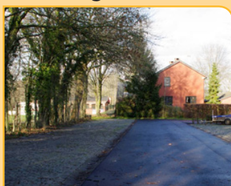
Parking KSK Donk

Asfaltering parking KSK Donk aan de sportterreinen Oude Landen. De parking bestond voorheen uit een locatie met zand en keien die na regenweer regelmatig vol plassen en putten stond. Voor onze eigen inwoners en de vele gebruikers van buiten ons district was dit een doorn