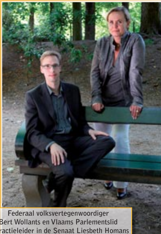
Federaal volksvertegenwoordiger Bert Wollants en Vlaams Parlementslid en fractieleider in de Senaat Liesbeth Homans zijn de N-VA-specialisten op het vlak van energie.

Uw energiefactuur swingt de pan uit. De toekomstige energiebevoorrading moet verzekerd blijven. En het is in Vlaanderen weinig realistisch om alle energie voor 100 % uit hernieuwbare bronnen te halen. Daarom ontwikkelde de N-VA een evenwichtige totaalvisie op energie.