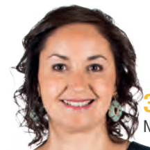
3 Nabilla Ait Daoud