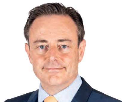
1 Bart De Wever