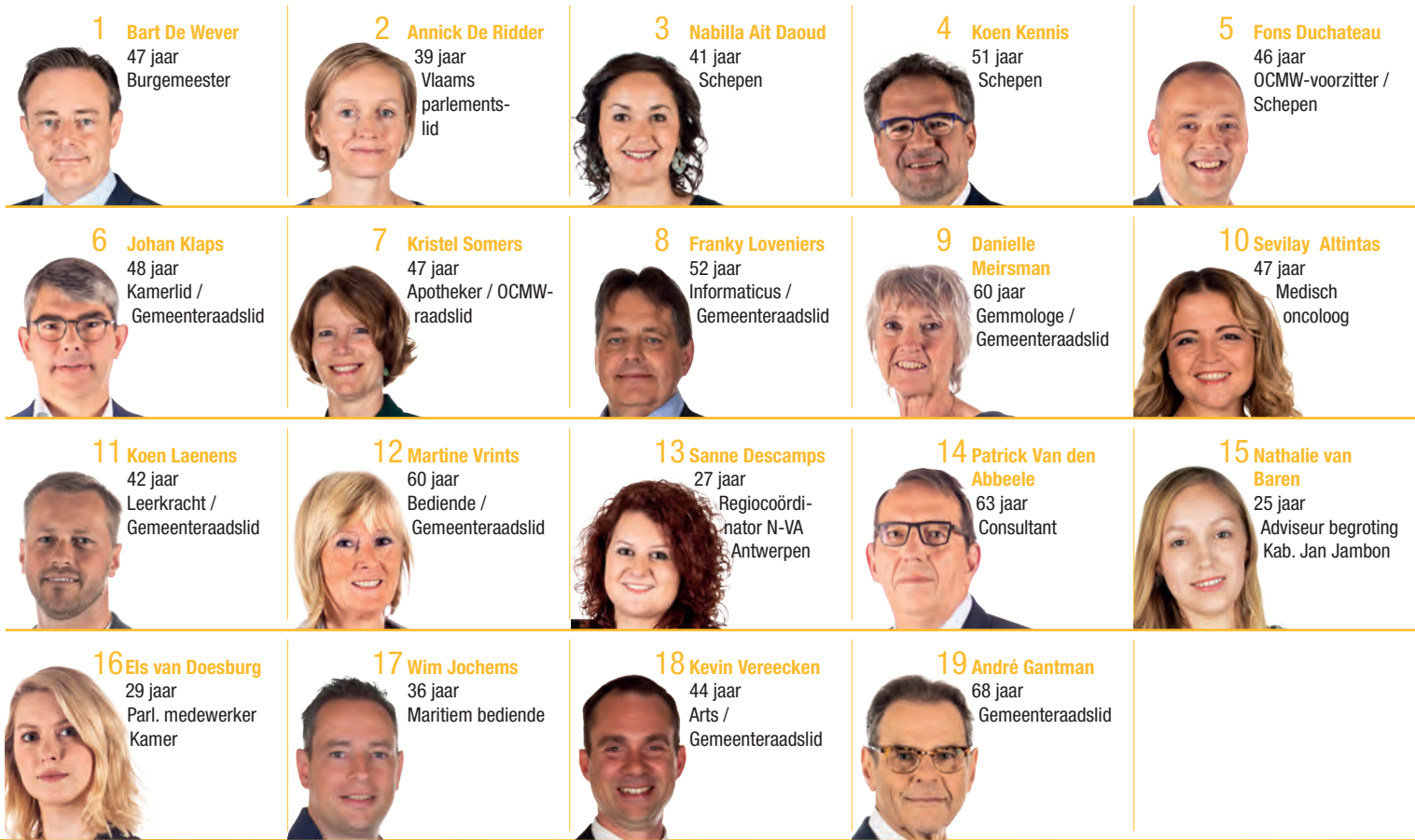
1 Bart De Wever 47 jaar Burgemeester